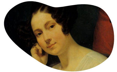
Mademoiselle Anaïs par Henry Scheffer, 1833, Collection Théâtre Français

Précédée d'une conférence le 29 mai, 20h30 "Les secrets d'Anaïs - sa part de mystère" Salle Anaïs, place des Ecossais, VLR.